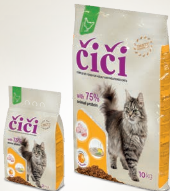
Pakend 2 ja 10 kg