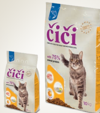
Pakend 2 ja 10 kg